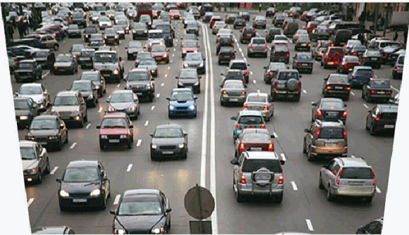
Avec fonction Up View

La fonction Up View d'EIZO veille à ce que les couleurs ne paraissent pas délavées lorsque vous devez lever les yeux vers l'écran. C'est un avantage lorsque l'écran est fixé à un mur ou au plafond, par exemple.