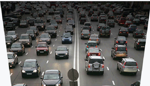
Sans fonction Up View